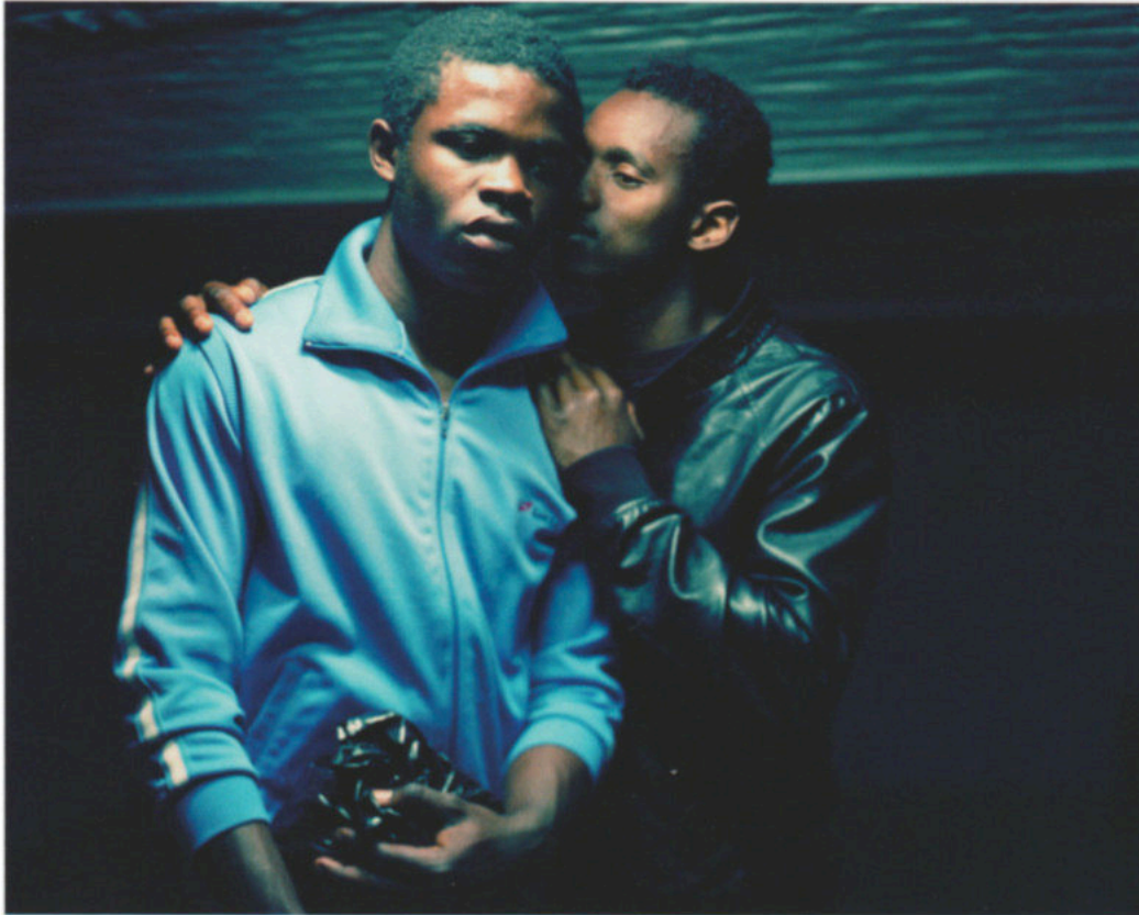
Laura Henno, The Story Teller , 2012

Art Paris fête cette année son 25ème anniversaire avec une édition mettant l'accent sur l'engagement. Entretien avec Guillaume Piens, son commissaire général depuis 2012.