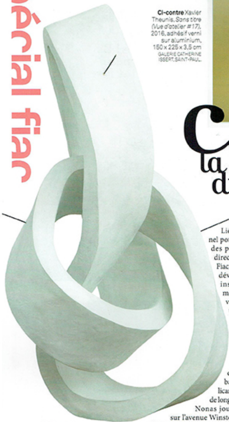
Ci-dessus Evan Holloway, Untitled , 2017, fibre de verre, 188 x 94 x 83,8 cm DAVID KORDANSKY GALLERY, LOS ANGELES