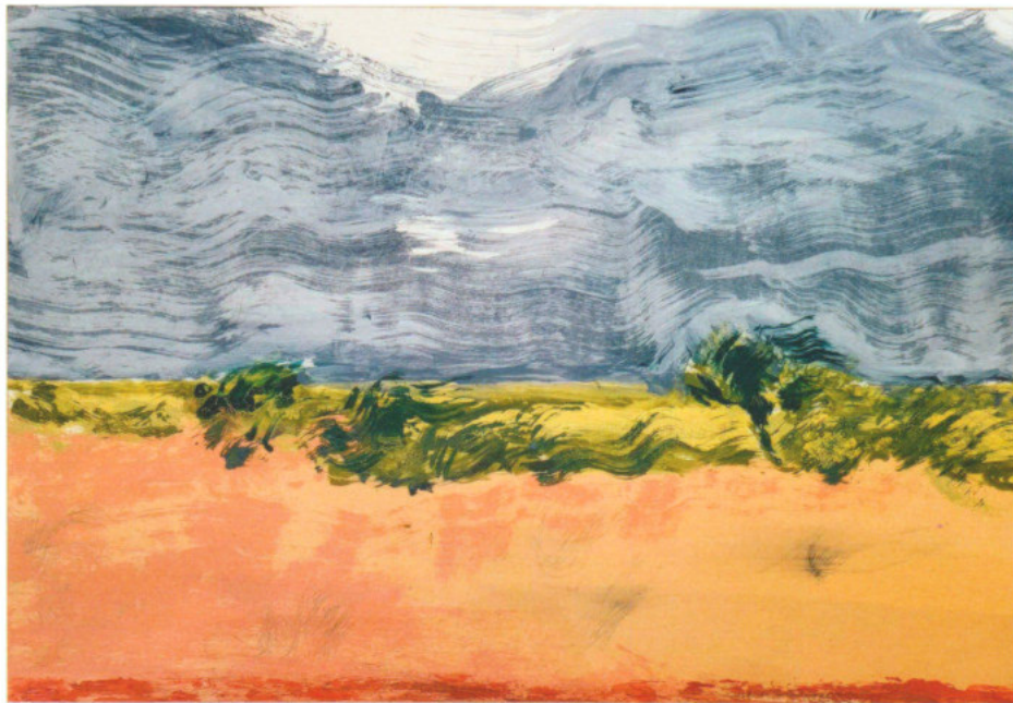
Marine Wallon, Point rouge ligne jaune XV, 2002 © Courtesy de l'artiste et Galerie Catherine Issert

Rendez-vous incontournable des amateurs d'art contemporain, la Drawing Now Art Fair s'installe de nouveau au Carreau du Temple fin mars avec 73 galeries (dont 30 % étrangères) proposant un vaste panorama des pratiques du dessin des 50 dernières années. Pour cette 16 e édition les femmes sont particulièrement mises en valeur.