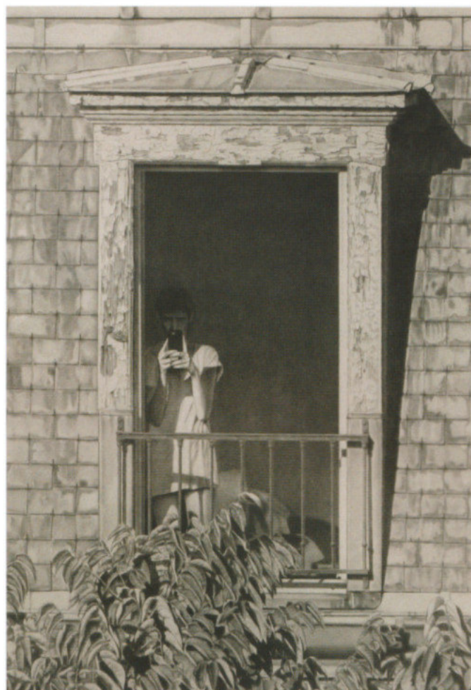
João Vilhena, L'amour des corps , 2019, © Courtesy de l'artiste et Galerie Alberta Pane